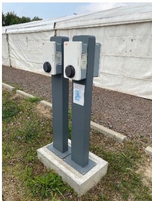
Abb. 2: Seitenansicht.