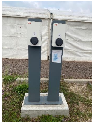
Abb. 3: Frontansicht.