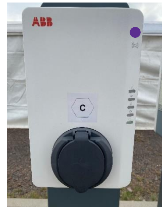
Abb. 4: Detailansicht.